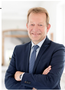
Steffen Mues Bürgermeister